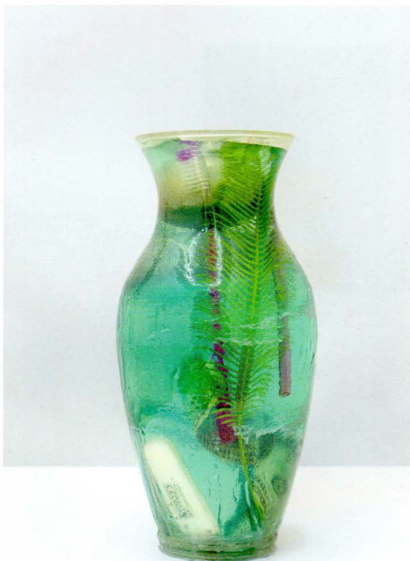
Lindsay Lawson, Both Worlds 2017 27 x 11 cm Thunderbolt-kabel, voks, Surf Stick, tannbørste, stålbull, kunstig blad, fargeblyanter, dollarseddel